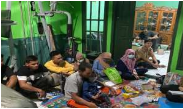
Gambar 6. Peserta Abdimas