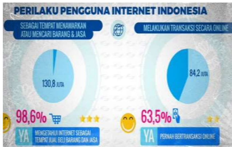
Gambar 2. Perilaku Pengguna Internet di Indonesia

Hal ini dibuktikan dari perilaku penggunaan internet di Indonesia untuk mencari barang atau jasa, bahkan melakukan transaksi jual-beli secara online. Untuk lebih lengkapnya dapat dilihat pada gambar berikut ini: