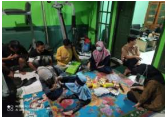
Gambar 3. Persiapan Abdimas

Kegiatan tim abdimas juga di dokumentasikan melalui video dan foto. Beberapa foto tim abdimas saat melakukan kegiatan abdimas di UD. Arida Tirta Jaya (FF. TIRTA) Jakarta Timur dapat dilihat sebagai berikut: