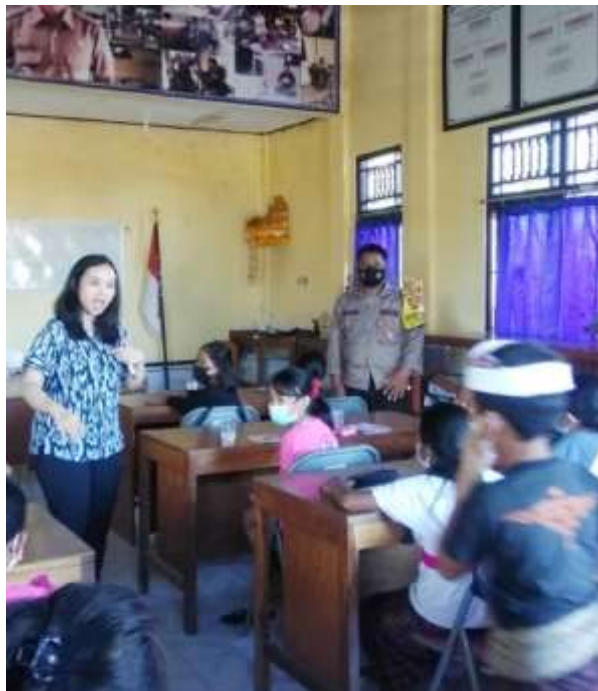
Gambar 4. Pelaksanaan Kegiatan

Berdasarkan situasi kelas yang majemuk, kuesioner evaluasi kegiatan disebar kepada seluruh perangkat desa yang dalam kegiatan pengabdian juga bertindak sebagai panitia pengawas kegiatan. Data hasil kuesioner menunjukkan hasil sebagai berikut: