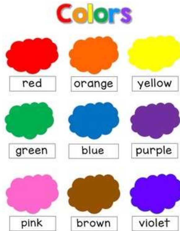
Gambar 3 Materi Pengajaran Bahasa Inggris Dasar “Warna”